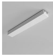
40121 Rosace avec alimentation électrique Hush