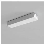
40120 Rosace avec alimentation électrique Hush