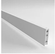
40157 Joint Eye