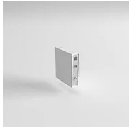
40155 Joint Eye