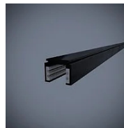
592J Binario elettrificato