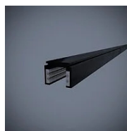
520 Binario elettrificato