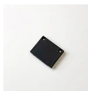
523 Testa di chiusura