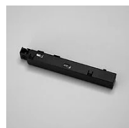
522 Alimentazione 48 V per binario elettrificato