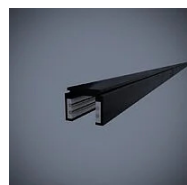
519 Binario elettrificato