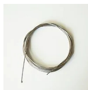
526J Cavo di sospensione per binario elettrificato