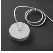
30721 Rosace Shanghai