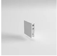
40155 Joint Eye