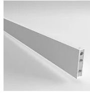
40157 Joint Eye