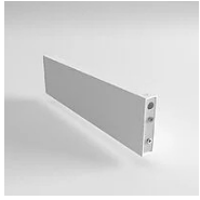
40156 Joint Eye