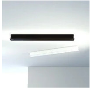
40221 Rosace linéaire