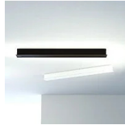
40222 Rosace linéaire